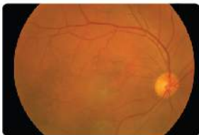
正常眼睛的視神經

什麼是視神經？視神經是超過一百萬條神經線的組織，連接眼底的視網膜（一層非常感光的組織）及大腦。要擁有良好的視力，健康的視神經是必需的。